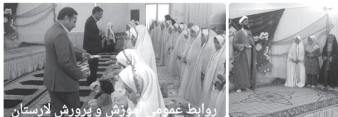
روابط عمومی آموزش و پرورش لارستان

در طرحی ابتکاری و برای اولین بار در سطح مدارس لارستان آموزش پایه سوم ابتدایی دبستان قرآنی دخترانه شادروان رجایی لاری که امسال به سن تکلیف رسیده و اولین روز از روزه داری خود را تجربه می کنند، به شکرانه انجام این تکلیف الهی جشنی معنوی برگزار نمودند.