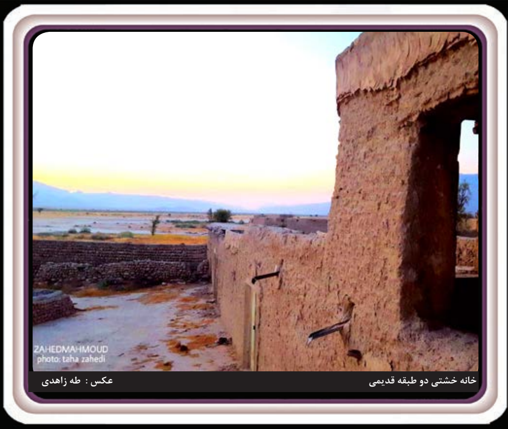
خانه خشتی دو طبقه قدیمی