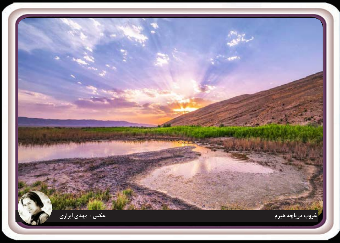
غروب دریاچه هیرم