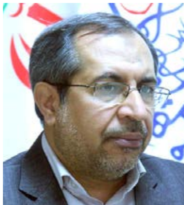
شهر لار به عنوان محل دائمی مجمع شهرداری های فارس، بوشهر و هرمزگان در راستای گسترش همکاری های شهری و مهم تر از آن تلاش به منظور عقد تفاهات خواهرخواندگی بین شهرداری لار با شهرداری های کشورهای آسیایی و اروپایی در راستای توسعه اقتصادی، سیاسی و اجتماعی منطقه لارستان را از دیگر موارد مهمی برشمرد که بایستی در دوره جدید و در راستای توسعه شهری از سوی شهرداری لار دنبال شده و از سمت شورای شهر و مسئولان شهری مورد توجه و حمایت قرار گیرد.