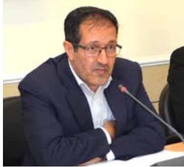
نمونه گردشگری جمعیت و مسافران را به این شهرستان جذب کرد.

فرماندار ویژه لارستان، با بیان اینکه انجام پروژه های اجرایی و عمرانی محدودیت های اعتباری و درآمزی برای دولت وجود دارد، افزود: با توجه به توانمندی های اقتصادی شهرستان لارستان می توان با فراهم سازی سرمایه گذاری رونق اقتصادی در این منطقه را رقم زد که در این زمینه اتاق فکر تشویق و جذب سرمایه گذاری برای فعال کردن توسعه اقتصادی در فرمانداری لارستان تشکیل شد. این مسئول، شهرستان لارستان را قهرمان و مهد فعالیت های نیک اندیشه و عام المنفعه در سطح کشور معرفی کرد و گفت: می بایست با مشارکت خیرین برای آبادانی منطقه لارستان در زمینه رونق اقتصادی نیز این شهرستان با سرمایه گذاری