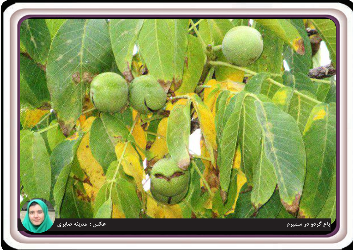
باغ گردو در سمیرم

از مهمترین طرح های افتتاح شده در لارستان، افزایش ظرفیت پست ۶۶ کیلو ولت فوق توزیع لطیفی لارستان همراه با تعویض دو دستگاه ترانس قدرت ۳۰ مگاوات و دو دستگاه ترانس ۴۰ مگا ولت آمپر با اعتبار ۴ میلیارد تومان، بوستان فسیل(نخل) در زمینی به مساحت ۱۲۶۵۸ متر مربع شامل فضای سبز، وسایل تفریحی و ورزشی، مسجد، پارکینگ، پیست دوچرخه سواری، اچپیک و سرویس بهداشتی با اعتباری افزون بر یک میلیارد و ۲۰۰ میلیون تومان، زیرسازی و