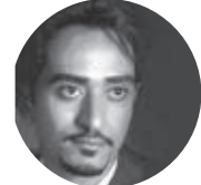
یادداشت: دکتر حامد مقدم پیاده‌سازی مطالب: حسین داوری

یکی از نقاط ضعف مدیریت شهری امروزه ما به طول مدت میان صدارت شورا و شهرداری بازمیگردد که این امر باعث می‌شود شهرداری‌ها پروژه‌هایی را در نظر بگیرند که در طول دوره خود بتوانند به انجام برسانند و مردم نیز آن را ببینند. این عامل باعث می‌شود پروژه‌های بلندمدت شهری رفته رفته