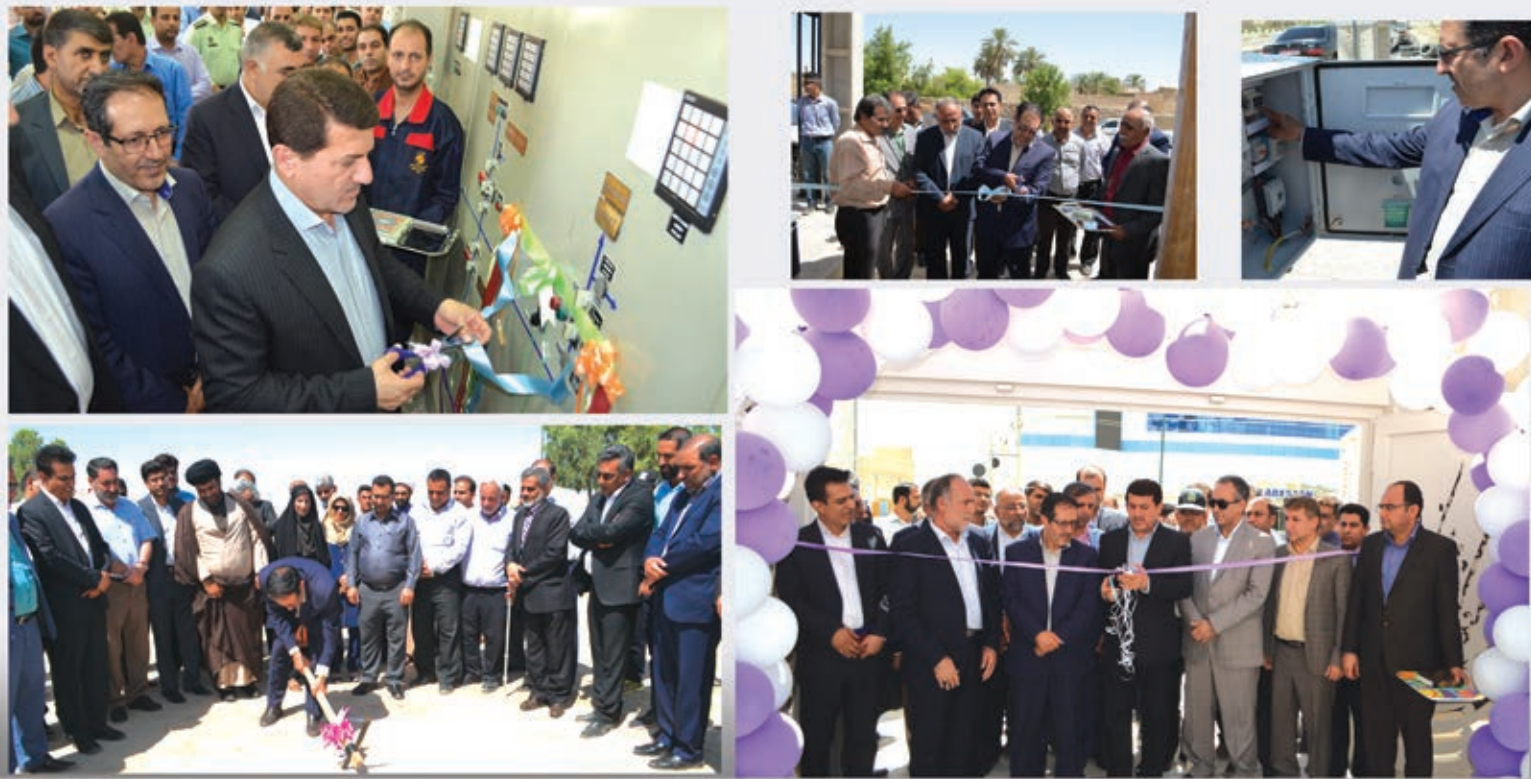
صفحه ۲ و ۸