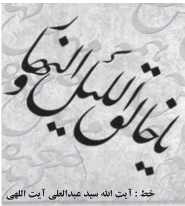
خط : آیت الله سید عبدالعلی آیت اللهی

کم شدن فاصله طبقاتی با اتفاق: با اتفاق، طبقاتی که نمی‌توانند بدون کمک مالی دیگران حوائج زندگی خود را برآورند حمایت می‌شوند و با نهی ثروتمندان از اسراف و تبذیر آنها را از تظاهر به ثروت باز می‌دارد. بدینوسیله فاصله طبقاتی دو قشر ثروتمند و فقیر جامعه را کم می‌کند. (المیزان ج ۲ ص ۲۸۷)