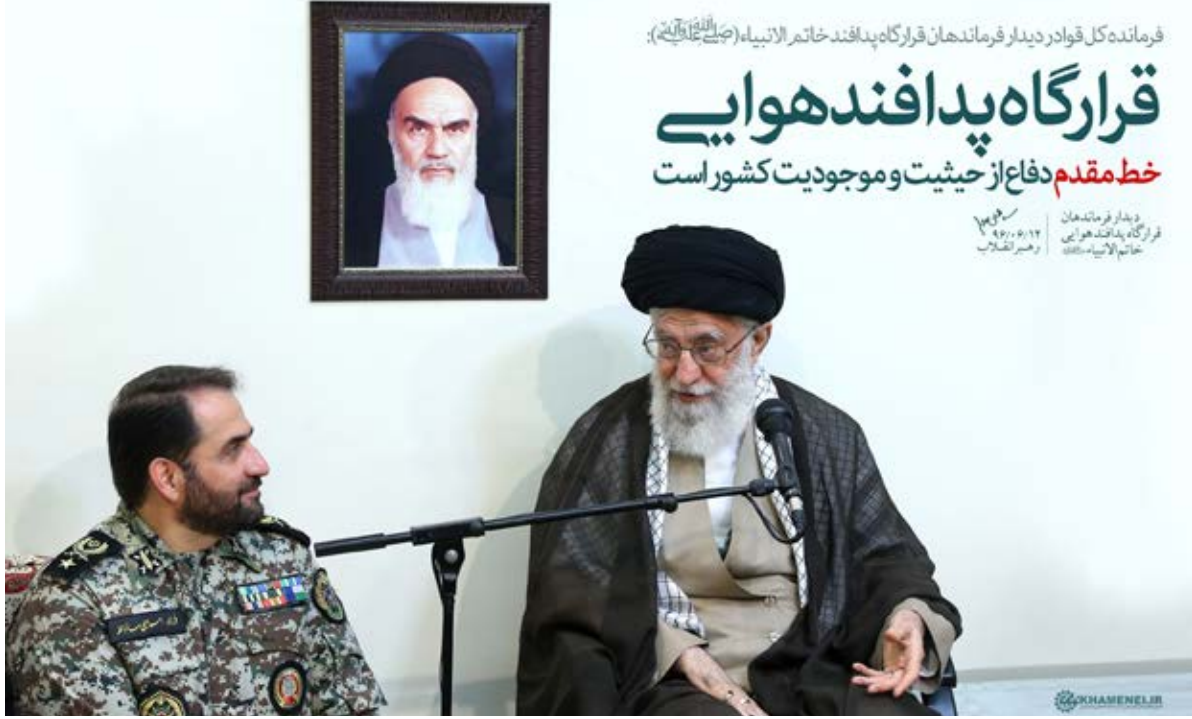
فرمانده کل قوا در دیدار فرماندهان قرارگاه پدافند خاتم الانبیا (عج) لارستان