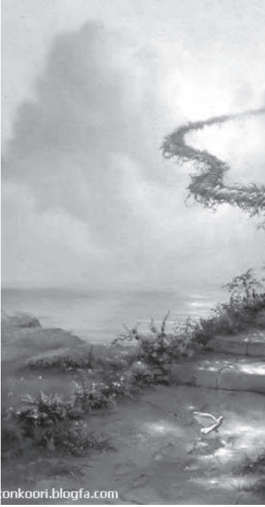
نویسنده: فاطمه ظریف پور