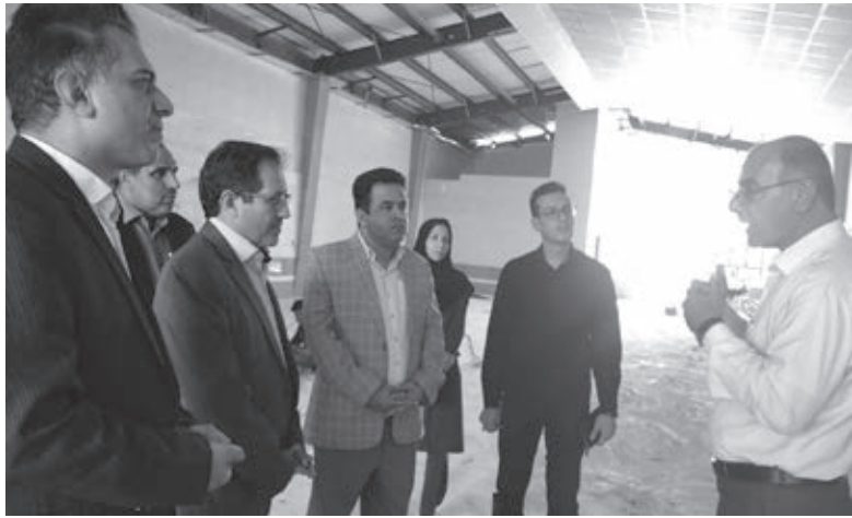
مرکز اورژانس اجتماعی هاشمی، شامل خط ۱۲۳ همراه با یک دستگاه آمبولانس است که به ارائه خدمات سیار و مداخله در بحران اجتماعی می پردازد. این مرکز دارای ۶ نیروی انسانی و تحت نظر اداره بهزیستی لارستان می باشد.