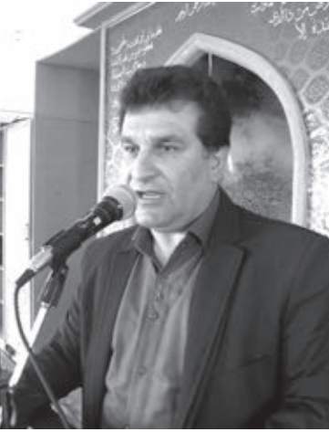
به گزارش میلاد لارستان به نقل از خبرنگار خبرگزاری آنا، مسابقات قران و عترت در بخش

مهدیزاده، به مسابقات و برنامه های قرآنی در واحد اشاره کردوگفت: با برکت کلام وحی، این واحد از جمله دانشگاه های مقام آور در سطح منطقه و کشور در مسابقات قران است وحضور گسترده استادان، کارکنان و دانشجویان در