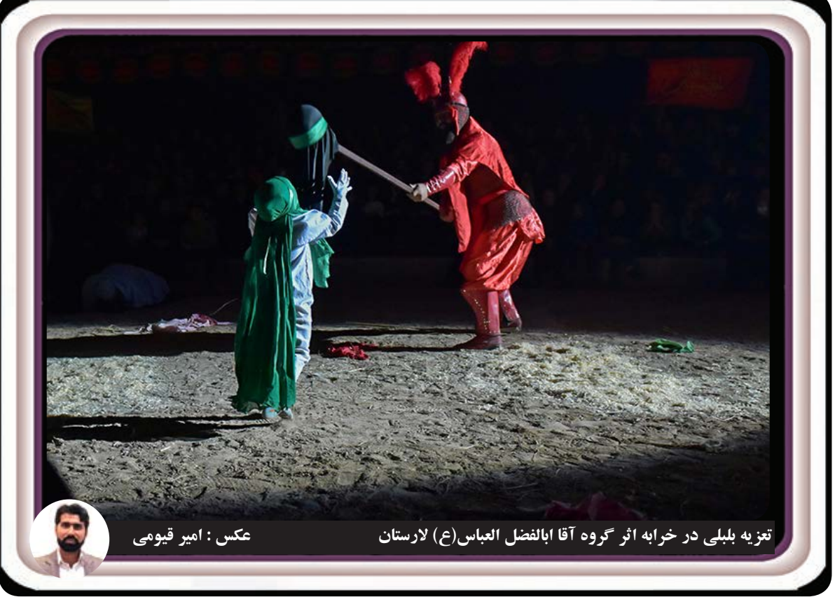
تغز به بلبلی در خرابه اثر گروه آقا ابوالفضل العباس(ع) لارستان