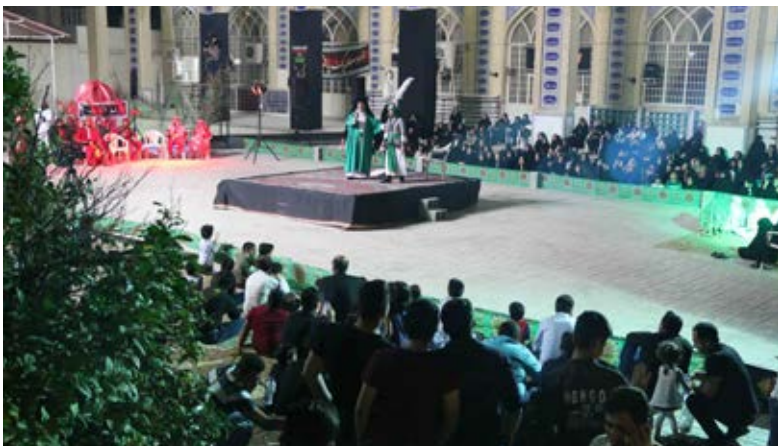
گروه فیلم برداری کانون های فرهنگی هنری لارستان، گردان ۴۰۳ امام حسین (ع) لارستان، گروه موزیک از شهرستان سامان شهردار، و به پایان رسید.

به گزارش گروه شهروند خبرنگار میلاد لارستان؛ مجلس تعزیه خوانی سنتی به مدت چهار شب، به همراه مراسم دمام زنی عاشوراییان در محل حسینیه سیدالشهدا (ع) لارستان برگزار شد.