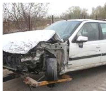
کامیون به شدت با یکدیگر برخورد کرده اند که در نتیجه آن دو نفر از سرنشینان یکی از خودروهای پژو ۴۰۵ کشته و سه تن دیگر مجروح شدند و به بیمارستان انتقال یافتند.

رئیس پلیس راه جنوبی استان فارس، با بیان اینکه علت وقوع این سانحه رانندگی در دست بررسی است، گفت: رانندگان، هشدارهای پلیس پیرامون مسائل راهنامه ای و رانندگی را جدی بگیرند و با آرامش رانندگی کنند تا از وقوع اینگونه حوادث جلوگیری شود.