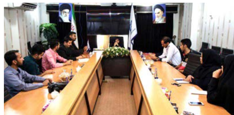
خود را مطرح کردند.

یگانه، نماینده دانشجوی بهداشتکاران دهان و دندان، به عنوان اولین سخنگو با اشاره به دغدغه این گروه دانشجویی که اکثرا بومی منطقه می باشند، گفت: درد بی پولی و هزینه های بالای دندان پزشکی، همراه همیشگی قشر ضعیف جامعه ماست که با حمایت مسئولین از دانشجویان بهداشت کار دهان و دندان و امکان حضور آنان در مراکز بهداشتی درمانی، با ارجاع به موقع این قشر، می تواند تا حدی این مسئله را مرتفع نمایند. تعیین تکلیف وضعیت شغلی از جمله مشغله های فکری است که علاوه بر رفع نیاز منطقه می تواند شرایط تحصیل در محیطی آرام را فراهم کند.