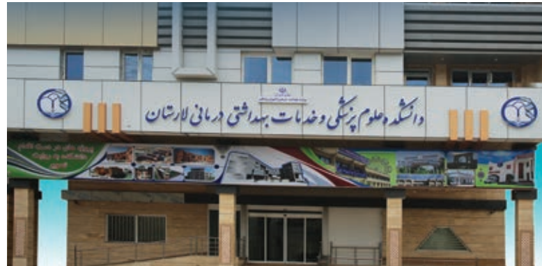
پایش وزارتخانه مورد تقدیر و تشکر قرار گرفت. دانشگاههای مطرح کشور در جایگاه بالاتری شایان ذکر است لارستان به نسبت بسیاری از

به گزارش روابط عمومی دانشکده علوم پزشکی و خدمات بهداشتی درمانی لارستان، با تلاش همکاران در ثبت و بارگذاری مستندات برنامه عملیاتی که یکی از برنامه های مورد تاکید وزارت بهداشت میباشد و مجموعه ای از گامهای عملیاتی است که انجام می شود تا به اهداف از پیش تعیین شده سیستم برسیم؛ این دانشکده بعد از دانشگاههای اصفهان، تهران و اسفراين موفق به کسب رتبه چهارم کشوری و اول استانی گردید.