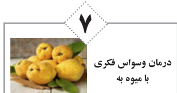
درمان وسواس فکری با میوه به