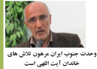
وحدت جنوب ایران مرهون تلاش های خاندان آیت اللهی است