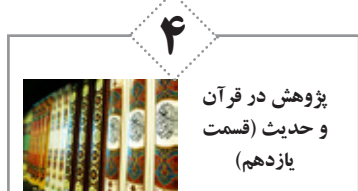
پژوهش در قرآن و حدیث (قسمت یازدهم)