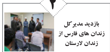
بازدید مدیرکل زندان های فارس از زندان لارستان