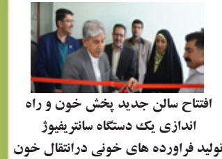
افتتاح سالن جدید پخش خون و راه اندازی یک دستگاه ساترفیوژ تولید فراورده های خونی در انتقال خون

رهبر انقلاب: به فضل پروردگار، این ملت قدرت آن را دارد که بدون اعتنا به خصومت‌های دشمنان و بدون این که پیش کسی دست دراز کند، کشور و خانه‌ی خود را با دست خودش بسازد