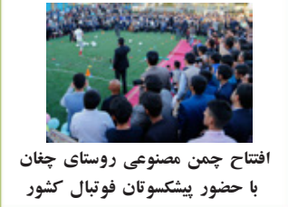
افتتاح چمن مصنوعی روستای چغان با حضور پیشکوتان فوتبال کشور