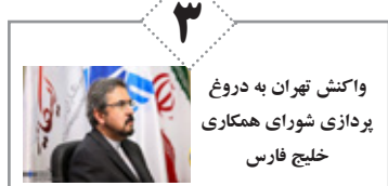
واکنش تهران به دروغ پردازی شورای همکاری خلیج فارس