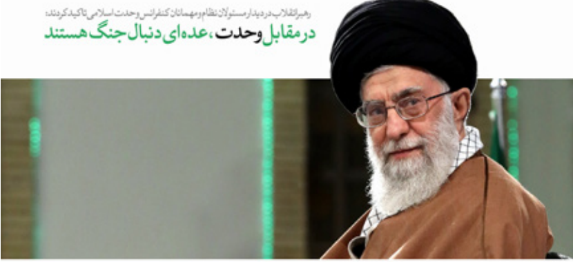
در مقابل وحدت، عده های دنبال جنگ هستند