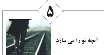
آنچه تو را می سازد