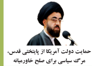
حمایت دولت آمریکا از پایتختی قدس، مرگ سیاسی برای صلح خاورمیانه