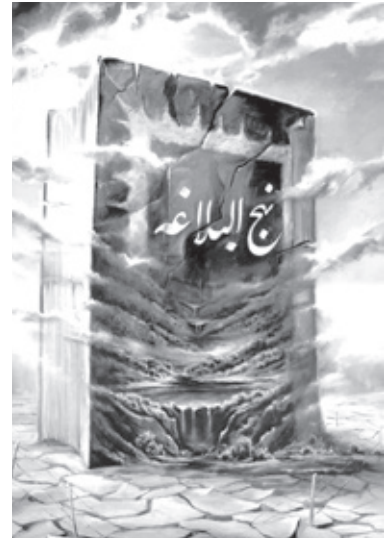
۷-عَجِبْتُ لِمَنْ عَرَفَ نَفْسَهُ كَيْفَ يَأْتِيهِ اِدَارُالْفَنَاءِ

گفته شده که انسان از خودشناسی به خداشناسی می‌رسد و طبعاً از خداشناسی به معادشناسی دست می‌یابد در مرحله اول اگر انسان بسنجد که همان نطفه بدویی بود که در رحم مادر قرار گرفت و اینک انسان برومندی شده که می‌تواند جهان بشریت را از منجلاب بدبختی راهی بخشد و گرفتاریهای جامعه را مرتفع نماید و با علم و عقل و قدرت و حکمت و عقل خدادادی می‌تواند به موشکافی اجرام سماوی بپردازد... می‌تواند به وجود خالق این جهان پی ببرد و به خداشناسی نائل آید. انسانی که به تمام معنی خدا را شناخت و به توحید الهی واصل شد دنیا برایش بی ارزش می‌شود زیرا او از طریق خداشناسی بقای مطلق را شناخته نمی‌تواند مسائل فانی را بپذیرد، چه رسد که به فانی‌ها دل بسته شود و با آنها انس و الفت برقرار نماید. پس شگفت‌انگیز است انسانی که ابعاد وجودی خود را بشناسد