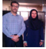
برگزاری دوره کلینیک طلایی درجه یک مریبگری فدراسیون شنا