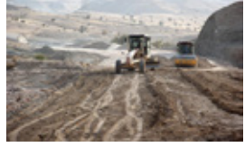
پیشرفت قابل توجه عملیات اصلاح و رفع نقاط حادثه ساز گردنه محمله