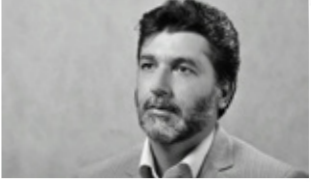
میریدی مدیر کل ارشاد تهران شد