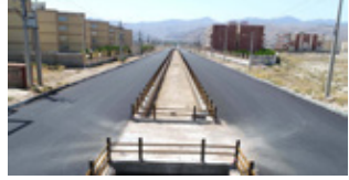
افتتاح ۱۴ پروژه شهرداری لار در دهه فجر انقلاب