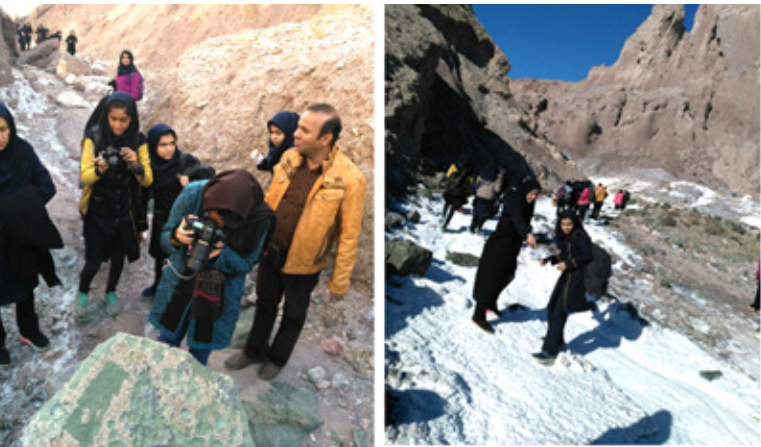
نفت و گاز و گردشگری قابل توجه است. می توانند بعضی از آنها ثبت بونسکو شوند. دبیر مطالعات اجتماعی متوسطه اول فرزانگان

به گزارش میلاد لارستان، این بازدید که با توضیحات کارشناسانه علی نخبه الفقهایی، دکتر زمین شناسی اقتصادی و مدرس دانشگاه و متخصص گنبد های نمکی همراه بود، در آستانه دهه فجر برگزار شد. این گنبد، دارای تنوع زمین شناسی و کانی شناسی بوده و دارای موادی چون آهن، دولومیت، نمک، گچ، انواع سنگ های آذرین است و ۴۳ کیلومتر مربع وسعت دارد و در کنار روستای کرمستج قرار دارد. همچنین این گنبد نمکی، دارای تنوع ژئومورفولوژیک بوده و می تواند در کنار سایر گنبد های نمکی لارستان، به عنوان یک مقصد ژئوتوریسمی مورد توجه قرار گیرد. ۷۰ درصد گنبد های نمکی ایران در منطقه لارستان قرار دارد و از لحاظ معدنی، ذخایر