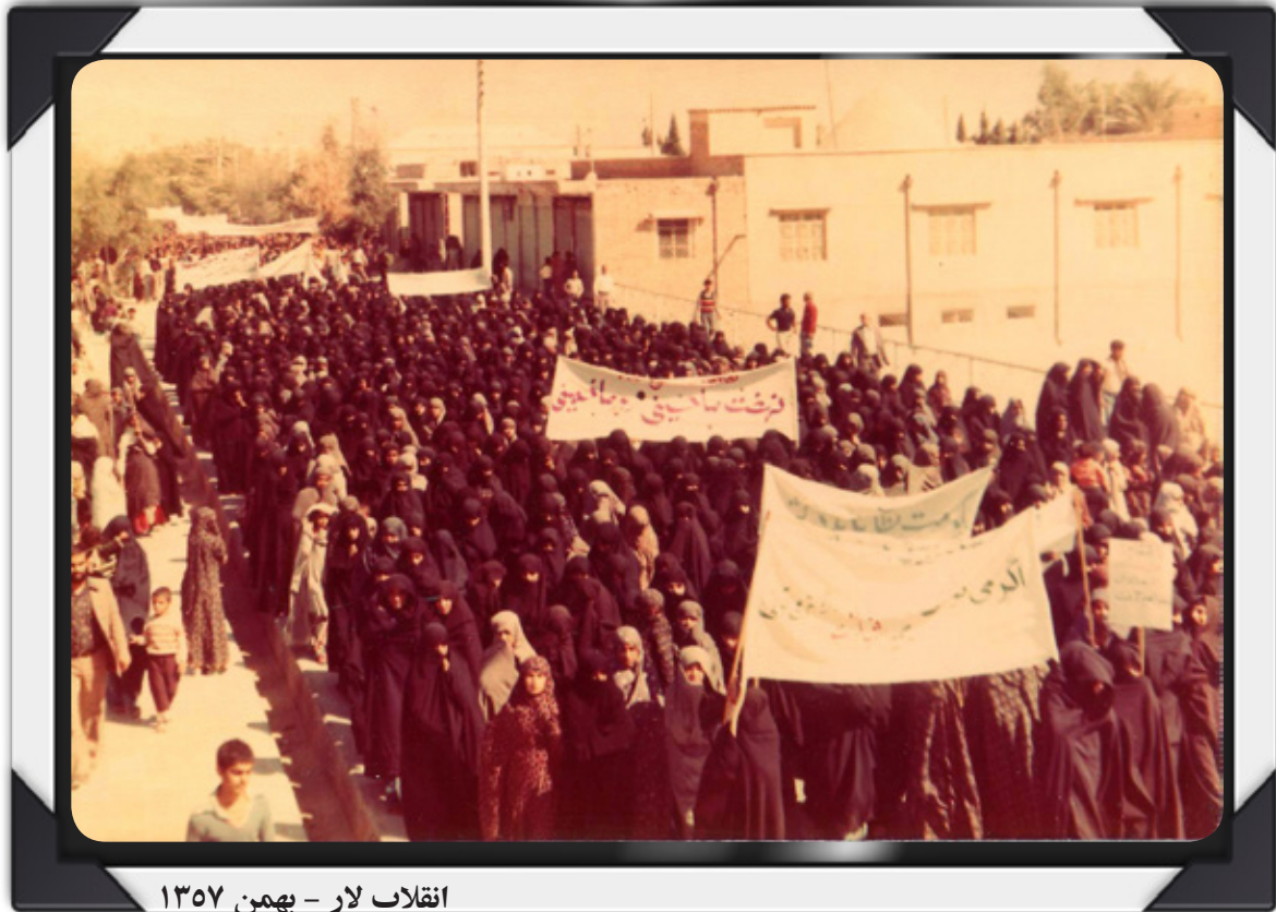
انقلاب لار - بهمن ۱۳۵۷