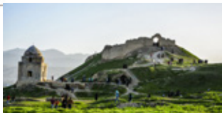
برای رونق گردشگری منتظر چه هستیم و باید تا کی منتظر بمانیم؟