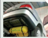
راه اندازی مرکز معاینه فنی خودروهای گازسوز در لار، به کجا انجامید؟