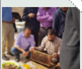
برگزاری دوره آموزشی پرورش زنبور عسل