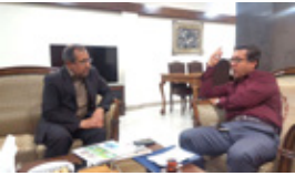
دیدار سیاحتی تجارتي بين نماينده مردم و رئيس منطقه آزاد كيش