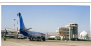
مدیرکل فرودگاه بین‌المللی لارستان: ساخت‌وسازهای اطراف فرودگاه لارستان، توسعه آن را با مشکل مواجه می‌کند