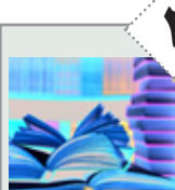
راهبایی «فیشر» به رقابت پایانی ۴۰ روستای دوستدار کتاب ایران