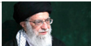
امام خامنه ای: آفت انقلاب «ارتجاع» است؛ من وظیفه دارم خطر را به مردم عزیزمان بگویم