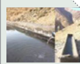
ساخت آبخشور در منطقه حفاظت شده هرمود