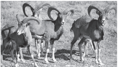
منطقه حفاظت‌شده هرمود:

شهرستان لارستان در جنوب استان پهناور فارس یکی از این مناطق است که در فصولی مانند بهار و زمستان به دلیل آب و هوایی مساعد علاوه بر آسمانی صاف و پرستاره برای علاقه‌مندان به نجوم و کوه‌های متعدد سر به فلک کشیده برای کوهنوردان، دارای جذابیت‌های گردشگری زیادی است که برخی از آن در زیر می‌آید: