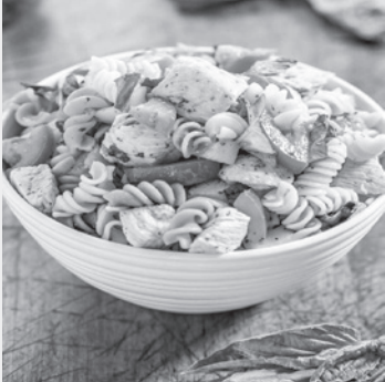
سالاد ماکارونی با گوشت و پنیر

بسیاری از افراد تصور می‌کنند که سالاد ماکارونی تنها از ماکارونی شکل دار، سس مایونز و کالیاس تشکیل می‌شود. از این رو آن را غذایی ساده و آسان می‌دانند. اما باید بگوییم اگر دوست دارید که سالاد ماکارونی شما در عین خوشمزه بودن یک غذای کامل نیز باشد بهتر است همه مخلفات آن را به صورت کامل تهیه کنید. برای این کار هم باید بدانید که مواد لازم برای تهیه سالاد ماکارونی عبارتند از :