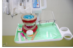
مردم از حمایت ضعیف بیمه‌ها از خدمات دندانپزشکی ناراضی‌اند