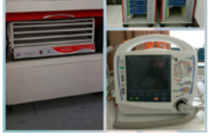
کمک ۸۰۰ میلیون ریالی یک نیک اندیش به بیمارستان اوز