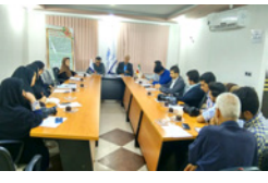
نوید افتتاح فاز یک مجتمع سرطانی صالح پور