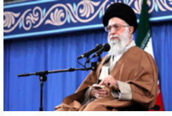
این را به همه بگویید...