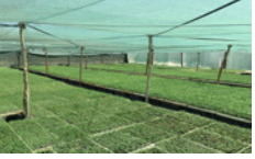
آغاز عملیات تولید نشاء گوجه فرنگی در گلخانه های لارستان