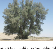
یابان های جنوب فارس، با درخت «گز» سبزی می شوند