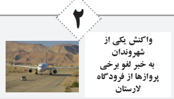
واکنش یکی از شهروندان به خبر لغو برخی پروازها از فرودگاه لارستان