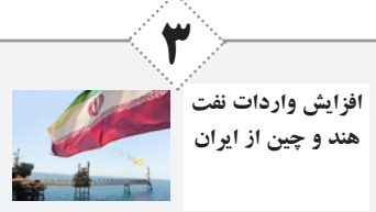
افزایش واردات نفت هند و چین از ایران