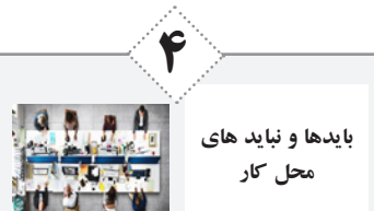
بایدها و نبایدهای محل کار