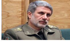
واکنش وزیر دفاع به پیشنهاد ترامپ برای مذاکره مستقیم با ایران