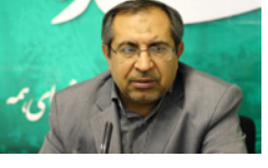
رسانه‌ها؛ بازتاب مطالبات مردم از مسئولان