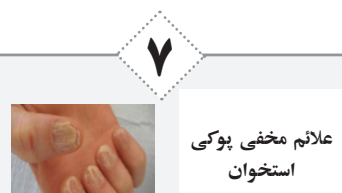
علائم مخفی پوکی استخوان