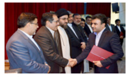
آئین تودیع و معارفه روسای دادگستری و دادستان عمومی لارستان