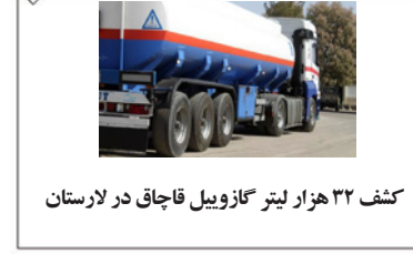
کشف ۳۲ هزار لیتر گازوییل قاچاق در لارستان