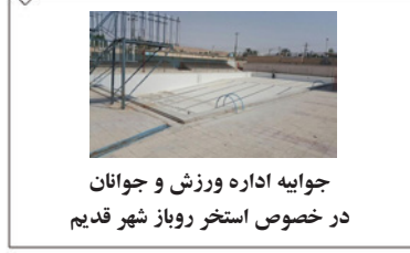
جوانیه اداره ورزش و جوانان در خصوص استخر روباز شهر قدیم