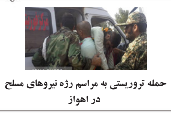
حمله تروریستی به مراسم رژه نیروهای مسلح در اهواز