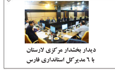
دیدار بخشدار مرکزی لارستان با مدیرکل استانداری فارس