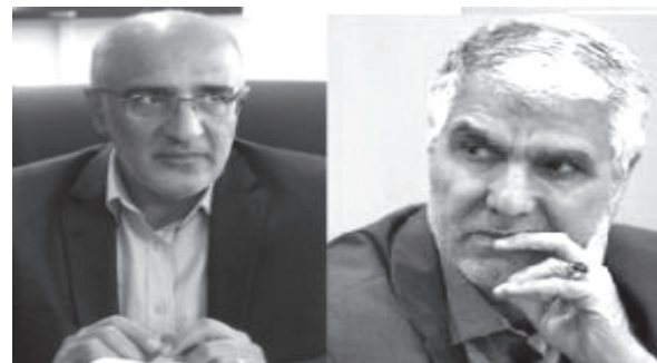
دارند، عنوان کرد: پایین ترین سطحی که می توانست بعد از بازنشستگی بار دیگر به کارگیری شوند معاونان استاندار بودند