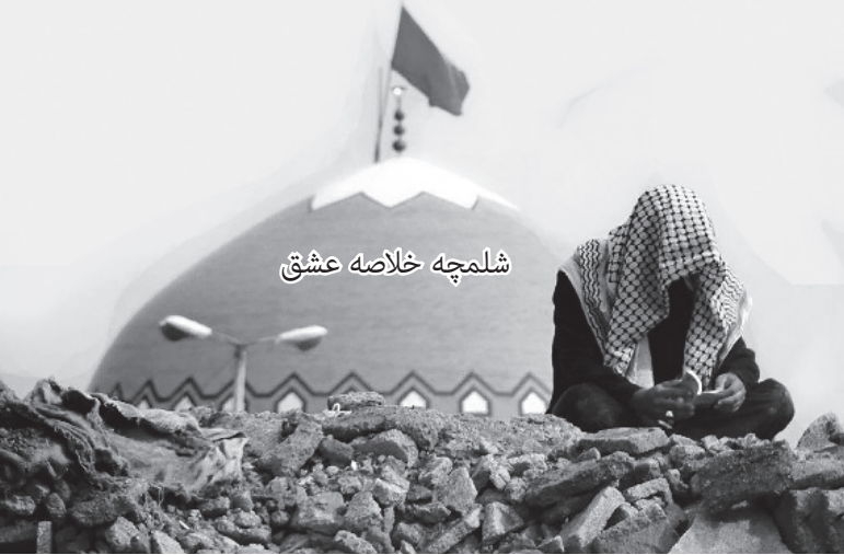
شلمچه خلاصه عشق