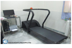
نصب و افتتاح دستگاه تست ورزش و هولتر مانیتورینگ در بیمارستان علی اصغر (ع) بیرم

روزنامه میلاد لارستان - سال بیست و ششم - آبان ماه ۱۳۹۷ - صفر المنظر ۱۴۴۰ - اکتبر ۲۰۱۸ - ۰۶/۰۸/۹۷ - شماره ۱۲۶۵ - صفحه ۸ - تک شماره ۱۰۰۰ تومان