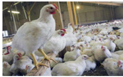
برگزاری کلاس آموزشی پیشگیری از بیماری آنفلوآنزای فوق حاد پرندگان