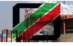
واردات ۱۱ هزار تن کالا به فارس