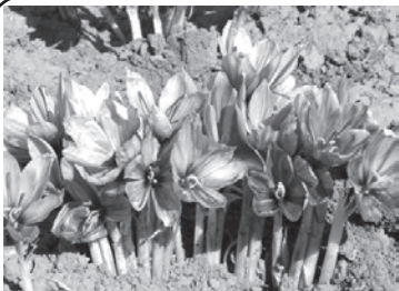
۲ هفته یکبار، با مواد تقویت کننده، تقویت کنید.

C. chrysanthus: این گونه گلپای کرم رنگ و آبی روشن خاکستری دارد.