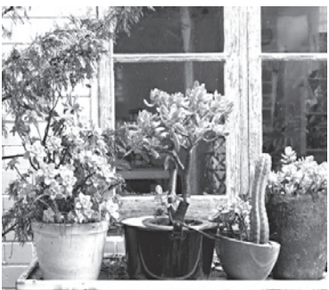
اگر در گروه افرادی هستید که علاقه زیادی به نگهداری گل و گیاه در منزل دارید، مطالعه

گیاه بسیار زیبای پتوس هم به خاک نیاز ندارد. اگر چه در خاک رشد سریع تری دارد اما در یک گلدان آب هم به حیات خود ادامه می دهد و باعث زیباسازی فضا می شود.