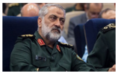
سختگوی نیروهای مسلح: ایران، نیازی به پایگاه نظامی در سوریه ندارد