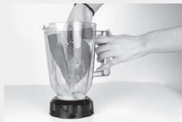
تمیز کردن پارچ مخلوط کن برقی

۱- درون یک ظرف مقداری آب گرم و چند قطره مایع ظرف شویی بریزید. با یک اسفنج یا حوله این محلول را روی پایه مخلوط کن بکشید و گرد و غبار و آلودگی‌های آن را به خوبی پاک کنید. توجه: هرگز پایه برقی مخلوط کن را با آب نشویید زیرا آب ممکن است موتور دستگاه مخلوط کن را خراب کند. ۲- سپس با یک دستمال و حوله مرطوب مواد شونده را از روی پایه مخلوط کن پاک کنید. توجه: سعی کنید قبل از اینکه لکه مواد غذایی روی پایه خشک شود، آن را با دستمال سریع پاک کنید. لکه مواد غذایی بعد از خشک شدن سفت و چسبنده می‌شود و پاک کردن آن بدون آب کار دشواری است. ۳- برای پاک کردن دکمه‌های پایه مخلوط کن، از الکل و یک گوش پاک کن استفاده کنید. گوش پاک کن را درون الکل فرو برده و اطراف و شکاف بین دکمه‌ها را به خوبی تمیز کنید.