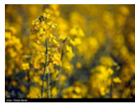
پیش بینی برداشت ۳۰ هزار تن کلزا از مزارع استان فارس