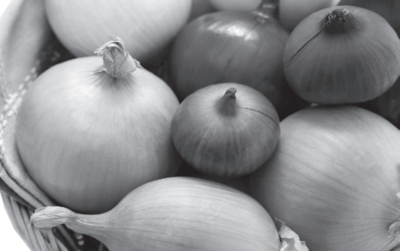
آسیب ناشی از مولکول های ناپایدار به نام رادیکال های آزاد محافظت می کند.پیاز سرشار از ویتامین های B، از جمله نقش کلیدی در سوخت و ساز، تولید گلبول های قرمز خون و عملکرد عصبی ایفا می کنند. در نهایت، پیاز منبع خوبی برای پتاسیم است که افراد بسیاری با کمبود این ماده معدنی مهم مواجه هستند. ارزش روزانه توصیه شده برای پتاسیم ۴۷۰۰ میلی گرم است که بسیاری تنها نیمی از این میزان را دریافت می کنند. عملکرد سلولی عادی، تعادل مایع، انتقال عصبی، عملکرد کلیه و انقباض ماهیچه ها همگی نیازمند پتاسیم است.