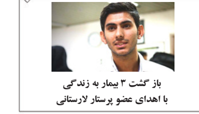
بازگشت ۳ بیمار به زندگی با اهدای عضو پرستار لارستانی

روزنامه میلاد لارستان - سال بیست و هفتم - دی ماه ۱۳۹۷ - جمادی الاول ۱۴۴۰ - زانویه ۲۰۱۹ - ۲۰/۱۰/۹۷ - شماره ۱۲۹۴ - صفحه تک شماره ۱۰۰۰ تومان