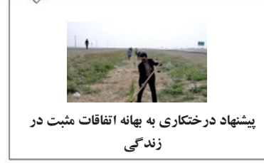
پیشنهاد درختکاری به بهانه اتفاقات مثبت در زندگی