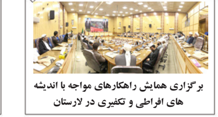
برگزاری همایش راهکارهای مواجهه با اندیشه های افراطی و تکفیری در لارستان