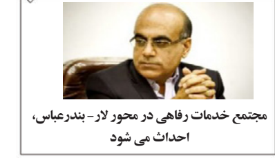
مجمع خدمات رفاهی در محور لار- بندرعباس، احداث می شود