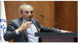
هشدار درباره نابودی کویرهای کشور