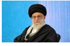
خانواده ایرانی در کلام رهبر انقلاب اعتماد، قراردادی نیست