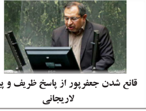
قانع شدن جعفرپور از پاسخ ظریف و پیشنهاد لاریجانی