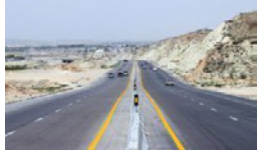
کلیتگ زنی قطعه سوم محور جهرم به لار