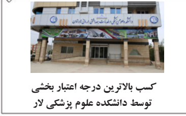
کسب بالاترین درجه اعتبار بخشی توسط دانشکده علوم پزشکی لار