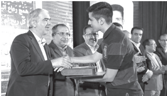
دیگر نهادهای اجتماعی و فرهنگی و سیاسی حضور داشته اند و می توان این ادعا را داشت که اگر ما توانمندی هایی را در حوزه‌های دیگر می بینیم این توانمندی ها از وجود دانش آموختگان دانشگاه و حوزه آموزش و پرورش هستند.

وی با اشاره به اینکه صحبت از ۴۰ سالگی انقلاب صحبت از یک واقعت بزرگ است که تمام جهان و قضا و مسائل دفاعی، همه اینها مواردی هستند که نمی توان چشم بر روی این واقعت‌ها بست.