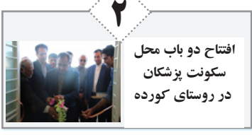
افتتاح دو باب محل سکونت پزشکان در روستای کورده