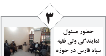
حضور مسئول نمایندگی ولی فقیه سپاه فارس در حوزه علمیه لارستان