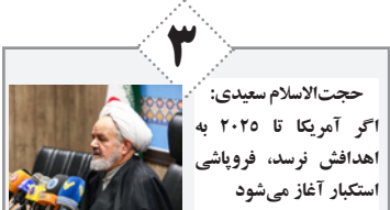
حجت‌الاسلام سعیدی: اگر آمریکا تا ۲۰۲۵ به اهداف نرسد، فروپاشی استکبار آغاز می‌شود