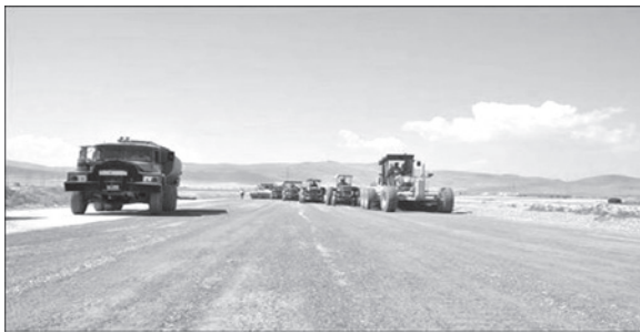
۲۵ کیلومتر، با ۲۱ درصد پیشرفت فیزیکی و ۴۰ میلیارد اعتبار در حال ساخت است. (۱۸همن ماه) با حضور استاندار فارس در جهرم آغاز شد.