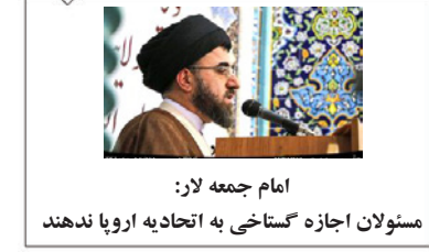
امام جمعه لار: مسئولان اجازه گستاخی به اتحادیه اروپا ندهند