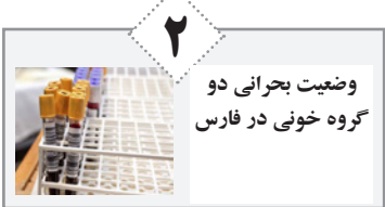
وضعیت بحرانی دو گروه خونی در فارس

درد خدا بر مردم با بصیرت و شجاع که نشان دادند تحریم و تهدید بر عزم قاطع آنها، ذره‌ای تأثیر نخواهد داشت