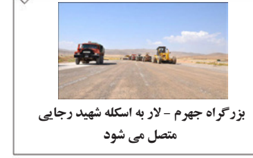
بزرگراه چهارم - لار به اسکله شهید رجایی متصل می شود