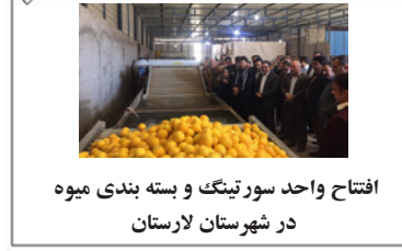
افتتاح واحد سورتینگ و بسته بندی میوه در شهرستان لارستان