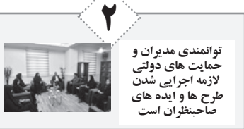
توانمندی مدیران و حمایت‌های دولتی لازمه اجرای شدن طرح‌ها و ایده‌های صاحبزنان است

علیرغم نوشتن چندین سرمقاله و درخواست از مدیر کل راه و شهرسازی در مورد راه‌های مواصلاتی لارستان از جمله محور لار - بندر عباس و لار - جهرم متأسفانه از ناحیه ایشان هیچ پاسخی دریافت نشده است.