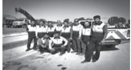
اعزام ماشین آلات راهسازی اداره کل راه و شهرسازی لارستان و ۶ اداره کل دیگر به خوزستان