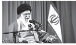
امام خامنه‌ای: گره رقصانی آمریکا علیه سپاه به جایی نخواهد رسید