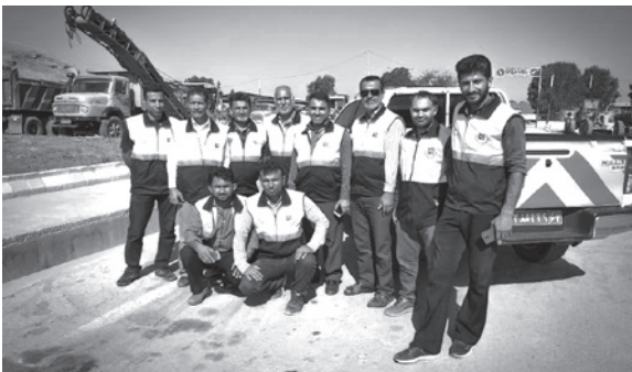
تسهیل و تسریع در اقدامات مربوط محورهای مواصلاتی استان به حوزه راهداری و راهسازی خوزستان اعزام گردد.

ساخت و توسعه زیربنای حمل و نقل و نماینده ویژه وزیر در مقابله با سیل استان خوزستان برگزار شد، مقرر گردید ۵۰ دستگاه ماشین آلات راهداری از ادارات کل راهداری و حمل و نقل جادهای هرمزگان، بوشهر، تهران، یزد، لارستان، کهگیلویه و بویراحمد و فارس به استان خوزستان اعزام شود. در این نشست همچنین مقرر شد ۲۰ دستگاه ماشین آلات بخش خصوصی جهت کمک رسانی و