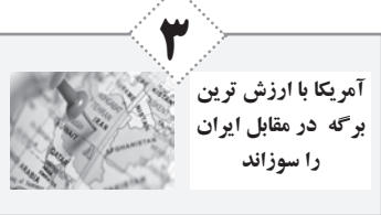
آمریکا با ارزش‌ترین برهه در مقابل ایران را سوزاند