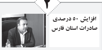
افزایش ۵۰ درصدی صادرات استان فارس