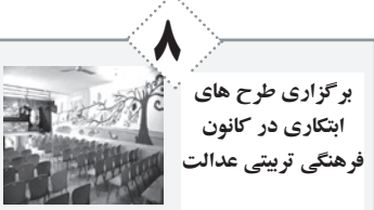
برگزاری طرح‌های ابتکاری در کانون فرهنگی تربیتی عدالت