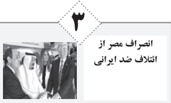
انصراف مصر از ائتلاف ضد ایرانی