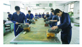
کسب مقام نخست هنرجوی یرمی در مسابقات علمی کاربردی استان فارس