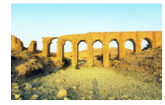
آبپاره مظفر لارستان، تخریب بنای ثبت ملی در نبود اعتبارات