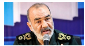
توانستیم به داستان ناوها خاتمه بدهیم / ما یک قدرت بزرگ و شکست ناپذیریم