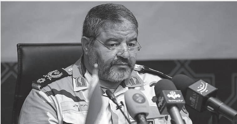
برنامه در این زمینه هستیم.

به گزارش میلادلاستان به نقل از تسنیم، سردار غلامرضا جلالی، رئیس سازمان پدافند غیر عامل کشور، در برنامه گفتگوی ویژه خبری شبکه دو سیما با برشمردن تهدیدهای سایبری و امنیت شبکه افزود: در حوزه این تهدیدات به توانمندی های قابل توجهی رسیده ایم و این نوع از حملات را می توانیم به آسانی دفع کنیم. وی گفت: در نمایشگاه سایبری امسال حدود ۴۰۰ درصد درمقایسه با نمایشگاه نخست از نظر تعداد و دقت کیفیت سامانه های سایبری رشد کرده ایم. سردار جلالی ادامه داد: در سامانه های کنترل صنعتی ۴ محصول امنیت بومی داریم که بهتر از سامانه های خارجی هستند. وی با بیان اینکه با معماری ویژه پدافندی، سامانه های کنترل صنعت گاز را ساخته و پیشرفت حدود ۲۰۰ محصول پایه پدافند سایبری در داخل ساخته شده است. وی با اشاره به حمله اخیر سایبری آمریکا به صنعت برق ونزوئلا و اختلال در صنایع راهبردی این کشور گفت: آمریکا در حالی که مدعی است که به این کشور حمله سایبری می شود اما بزرگترین مهاجم سایبری دنیاست. وی اضافه کرد: این رفتار آمریکا لزوم پرداختن ما به سامانه های بومی را نشان می دهد و همه دستگاه ها موظفند برای سامانه های حیاتی خود از سامانه های بومی استفاده کنند و سازمان پدافند غیر عامل این موضوع را پیگیری می کند.