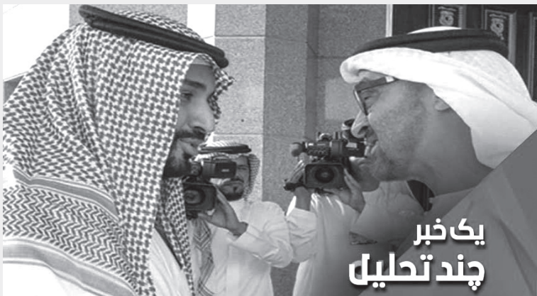
یک خبر چند تحلیل

خبر: □ ایران خواستار امضای پیمان «عدم تعرض» با کشورهای حاشیه خلیج فارس شد و از گفتگو با هر یک از این کشورها استقبال کرد. □ در حالی که دونالد ترامپ، رئیس جمهور آمریکا به خصوص پس از اعزام ناو هواپیمابر و چند فروند ناو و بمب افکن های ب ۵۲ و تفنگدار به خاورمیانه، منتظر پاسخ تهران به دعوت های مکرر آمریکا برای گفتگو بود، تهران سرانجام پیشنهاد گفتگو داد اما نه با ترامپ بلکه با کشورهای همسایه حاشیه خلیج فارس.