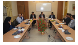
ابزار امیدواری فرماندار برای اتمام ساختمان مرکزی کتابخانه عمومی لارستان

روزنامه میلاد لارستان - سال بیست و هفتم - خرداد ماه ۱۳۹۸ - رمضان المبارک ۱۴۴۰ - مه ۲۰۱۹ - ۰۹/۰۳/۹۸ - شماره ۱۳۴۵ - صفحه تک - شماره ۲۰۰۰ تومان