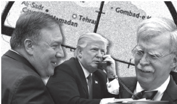
ها کار می کنند.

دیگر سوالی که درباره ایران از سخنگوی تازه کار وزارت خارجه آمریکا پرسیده شد، این بود که رئیس جمهوری ترامپ در ژاپن گفت که سیاست دولت او تغییر رژیم در ایران نیست. همچنین گفت که آنها می خواهند با ایرانی ها گفت و گو کنند. هنوز هم می گویند که ایران هرگز نباید سلاح اتمی داشته باشد. اگر ایرانی ها مذاکرات را همانگونه که به طور عمومی گفته اند، رد کنند، چگونه شما به آن دست خواهید یافت و چگونه این اظهارات را در کنار هم قرار می دهید؟ سخنگوی وزارت خارجه آمریکا پاسخ داد: تحریم های اقتصادی و کارزار فشار حداکثری همچنان در حال اجرا خواهند ماند. وقتی که زمان گفت و گو برسد، هر وقتی که رهبران ایران مایل به صحبت باشند، رئیس جمهوری و وزیر خارجه گفته اند که آنها هم انجام خواهند داد.