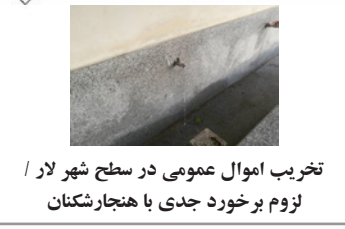
تخریب اموال عمومی در سطح شهر لار / لزوم برخورد جدی با هنجارشکنان