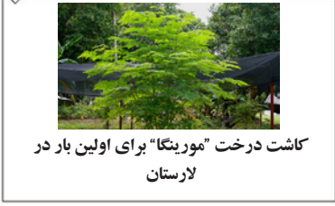
کاشت درخت "مورینگا" برای اولین بار در لارستان