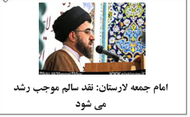
امام جمعه لارستان: نقد سالم موجب رشد می‌شود