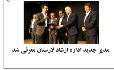
مدیر جدید اداره ارشاد لارستان معرفی شد