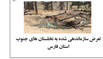
تعرض سازماندهی شده به نخلستان های جنوب استان فارس