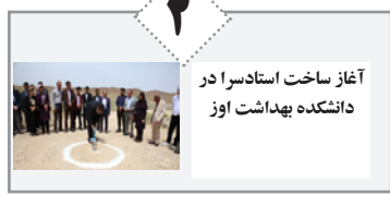
آغاز ساخت استادیوم در دانشکده بهداشت اوز