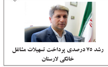
رشد ۷۵ درصدی پرداخت تسهیلات مشاغل خانگی لارستان