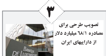
تصویب طرحی برای مصادره ۶۸۱ میلیارد دلار از داراییهای ایران