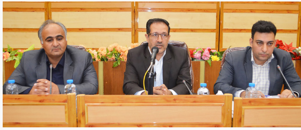
معاون استاندار و فرماندار ویژه لارستان گفت: امسال از محل اعتبارات ۳ در صد نفت و گاز و تملک دارایی های سرمایه ای استانی ۲۳ میلیارد و ۶۰۰ میلیون تومان به لارستان اختصاص یافت.