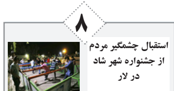
استقبال چشمگیر مردم از جشنواره شهر شاد در لار