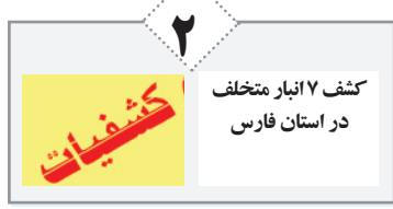
کشف ۱۷ ابار متخلف در استان فارس