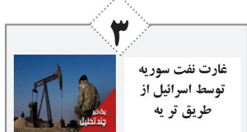
غار نفت سوریه توسط اسرائیل از طریق ترپه