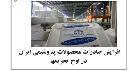
افزایش صادرات محصولات پتروشیمی ایران در اوج تحریمها