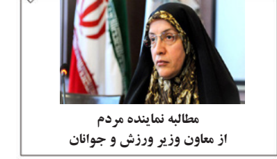
مطالبه نماینده مردم از معاون وزیر ورزش و جوانان