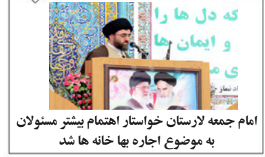
امام جمعه لارستان خواستار اهتمام بیشتر مسئولان به موضوع اجاره بها خانه ها شد