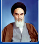
پیام امام خمینی (ره) به مناسبت قبول قطعنامه ۵۹۸

قبول این مسئله برای من، از زهر کشنده تر است؛ ولی راضی به رضای خدایم و برای رضایت او، این جرعه را نوشیدم. در شرایط کنونی، آن چه موجب این امر شد، تکلیف الهی‌ام بود. شما می‌دانید که من با شما پیمان بسته بودم که تا آخرین قطره خون و آخرین نفس بجنگم؛ اما تصمیم امروز، فقط برای تشخیص مصلحت بود و تنها به امید رحمت و رضای او، از هر آن چه گفتم، گذشته و اگر آبرویی داشتم، با خدا معامله کرده‌ام.