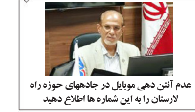
عدم آنتن دهی موبایل در جادههای حوزه راه لارستان را به این شماره ها اطلاع دهید