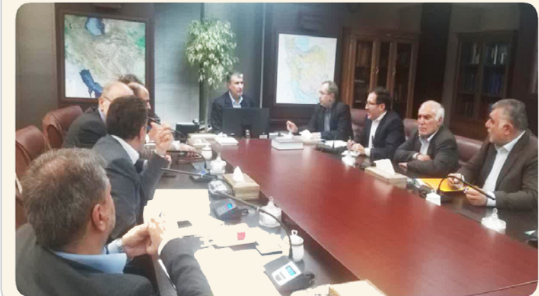
نمایندگانی از مجلس شورای اسلامی در جلسه با وزیر راه و شهرسازی در لار.

نماینده مردم لارستان در مجلس شورای اسلامی، با بیان اینکه مجموعه ای از کارها باید صورت بگیرد تا آمار تلفات و خسارات جاده ای را کاهش دهیم، گفت: فاصله بین