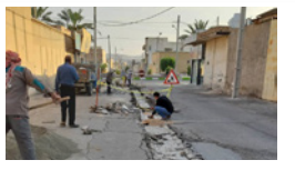
فعالیت های خدماتی اخیر شهرداری لار