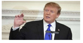
ترامپ: برای پیروزی در افغانستان این کشور را باید از روی زمین محو کرد!