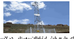
اجرای طرح پایش ارتباطات روستایی در لارستان

روزنامه میلاد لارستان - سال بیست و هفتم - مرداد ماه ۱۳۹۸ - ذی القعدة ۱۴۴۰ - جولای ۲۰۱۹ - ۰۳ / ۰۵ / ۹۸ - شماره ۱۳۶۶ - صفحه ۸ - تک شماره ۲۰۰۰ تومان