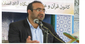
فعالیت ۲۰ رشته در مقطع کارشناسی ارشد در دانشگاه آزاد لارستان