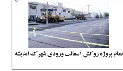
اتمام پروژه روکش آسفالت ورودی شهرک اندیشه

روزنامه میلاد لارستان - سال بیست و هفتم - مرداد ماه ۱۳۹۸ - ذی الحجه ۱۴۴۰ - آگوست ۲۰۱۹ - ۱۶/۰۵/۹۸ - شماره ۱۳۷۲ - ۸ صفحه - تک شماره ۲۰۰۰ تومان