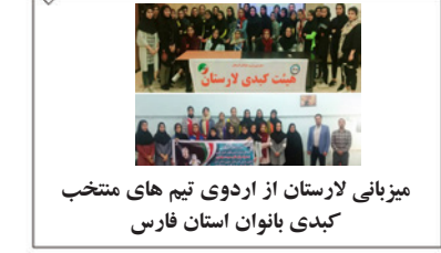
میزبانی لارستان از اردوی تیم های منتخب کبکدی بانوان استان فارس