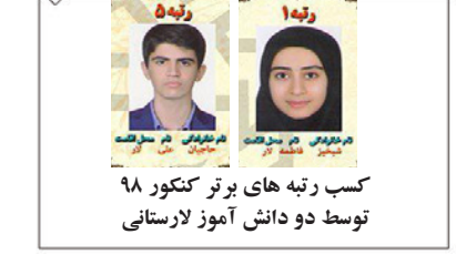
کسب رتبه های برتر کنکور ۹۸ توسط دو دانش آموز لارستانی