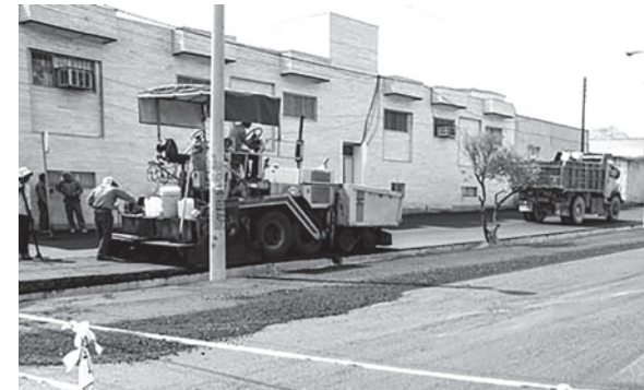
وحدت با هزینه ای بالغ بر ۱۸۰ میلیون تومان، خبرنگار: قنادی اجرایی شد.