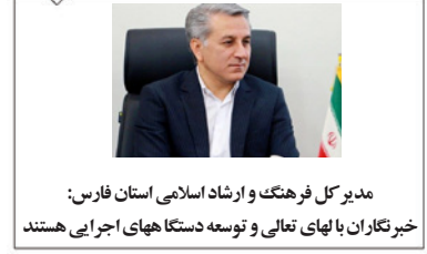
مدیر کل فرهنگ و ارشاد اسلامی استان فارس: خیرنگاران با لهای تعالی و توسعه دستگا‌های اجرایی هستند