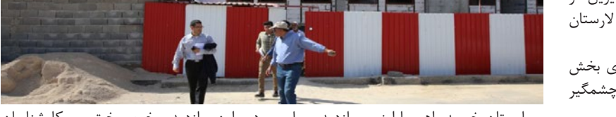
بیمارستان خیریه راهپیمیا اوز... بازدید بعمل آورد و از نزدیک پیشرفت فیزیکی پروژه ها را بررسی کرد.

این مسوول، با بیان اینکه آمریکا به دنبال آن است تا با مذاکره با ایران به دیگران به ویژه ملت های آزادی خواه نشان دهد، ایران تحت فشار حداکثری مجبور به مذاکره شده است، عنوان کرد: اگر آمریکا در این هدف موفق شود، از این به بعد