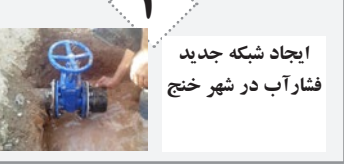
ایجاد شبکه جدید فشار آب در شهر خنج

لذا شایسته است خدا را در نظر بگیریم و بدون خب و بغض اسباب توسعه و ارتقاء لارستان را فراهم آوریم تا مشکلات مردم بهتر حل و فصل شود و خواسته به حق مردم لارستان جامه عمل پوشد.