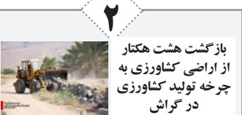
بازگشت هشت هکتار از اراضی کشاورزی به چرخه تولید کشاورزی در گراش