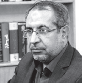
رئیس کمیسیون فرهنگی مجلس شورای اسلامی، توسعه بازیافت را یکی از راه های خروج از بحران کاغذ دانست.