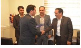
معرفی رئیس جدید جمعیت هلال احمر لارستان