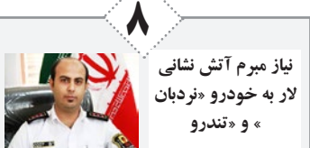
نیاز مرم آتش نشانی لار به خودرو «نردبان» و «تندرو»