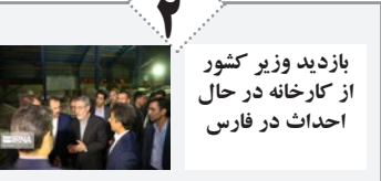
بازدید وزیر کشور از کارخانه در حال احداث در فارس