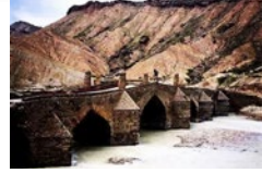
پل شاه عباسی لارستان