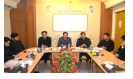
درخواست های نخبگان لارستان از فرماندار ویژه