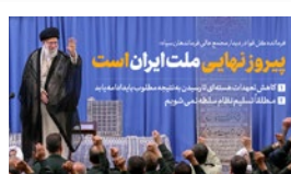
لیکک سازمان انرژی اتمی به رهبر انقلاب