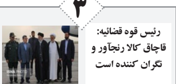
رئیس قوه قضائیه: قاچاق کالا رنجآور و تکران کننده است