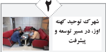
شهرک توحید کهنه اوز، در مسیر توسعه و پیشرفت