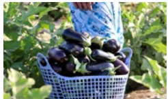
بادمجان «چاه نهر» مشتری ندارد

روزنامه میلاد لارستان - سال بیست و هفتم - آبان ماه ۱۳۹۸ - ربيع الاول ۱۴۴۱ - نوامبر ۲۰۱۹ - ۹۸/۰۸/۱۶ - شماره ۱۴۱۰ - صفحه ۸ - تک شماره ۲۰۰۰ تومان