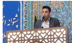
آموزش های همگانی ضرورت اتکار ناپذیر پدافند غیرعامل است