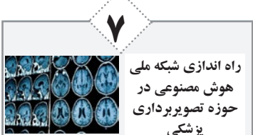
راه اندازی شبکه ملی هوش مصنوعی در حوزه تصویربرداری پزشکی