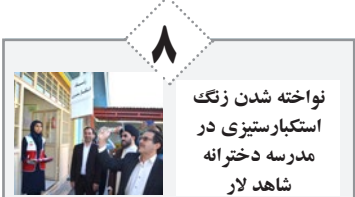
نواخته شدن زنگ استکبار ستیزی در مدرسه دخترانه شاهد لار