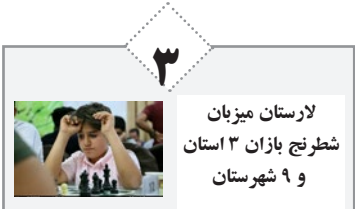
لارستان میزبان شطرنج بازان ۳ استان و ۹ شهرستان