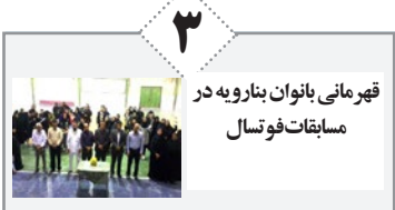
قهرمانی بانوان بنارویه در مسابقات فوتسال