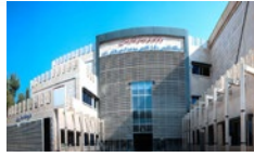
ارائه خدمات فوق تخصصی در درمانگاه هاشمی زاده لارستان