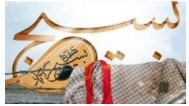
۴۰ سال خدمت، جهاد و شهادت: اجرای ۱۲۰ برنامه در هفته بسیج