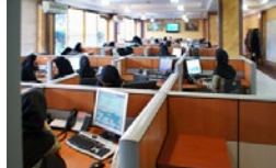
راه‌های موثر و ساده برای ایجاد انگیزه در محیط کار