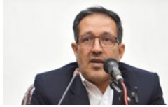
حسنی: تکذاریم افرادی سود جو به بهانه افزایش بنزین، گران فروشی کنند