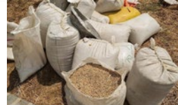
کشف سه انبار احتکار گندم در لارستان