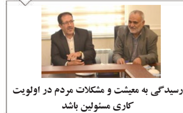
رسیدگی به معیشت و مشکلات مردم در اولویت کاری مسئولین باشد