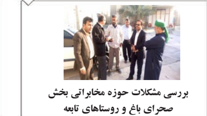
بررسی مشکلات حوزه مختاری بخش صحرای باغ و روستاهای تابعه