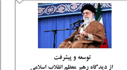
توسعه و پیشرفت از دیدگاه رهبر معظم انقلاب اسلامی