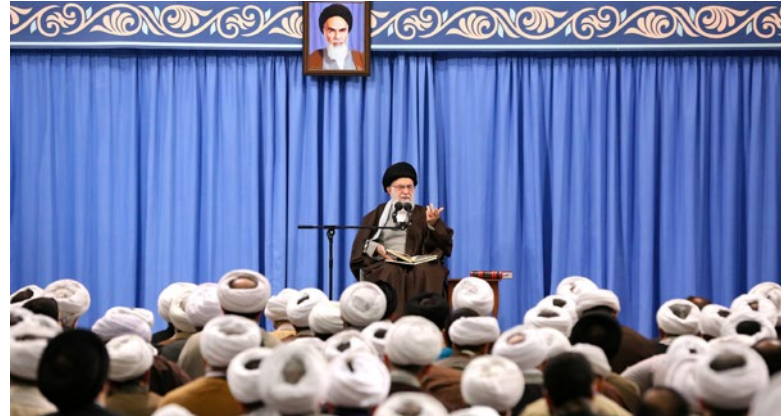
درد. خب حالا آن حرفی که حضرت میخواهد به ای‌ذر بزند چیست؟

اینکه یک مسندی، یک جایی، یا خالی می شود یا ممکن است خالی بشود، فوراً چشم میدوزیم که برویم آنجا! خب شما اول نگاه کن ببین میتوانی یا نمیتوانی. حالا بحث اسم‌نویسی برای انتخابات مجلس است، گفتند شروع شده، همین طور بدون محابا میروند! خب شما که میخواهی بروی آنجا، آنجا سوال دارد؛ این توانایی‌ای که خدا به من و شما میدهد، کنارش مسئولیت هست. این امطبی [ا] که عرض میکنم، در مورد خود این حقیر از همه بیشتر است. شما هم همین جور؛ یعنی آن کسانی که مسئولیتی دارند، همین جور، هر مسئولیتی، هر سمتی، هر توانایی‌ای، در کنارش یک مسئولیتی دارد، یک تعهدی وجود دارد. میتوانید آن تعهد را انجام بدهید یا نه؟ این خیلی درس بزرگی است.