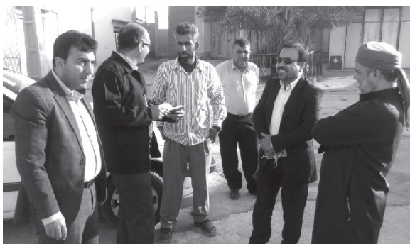
با حضور مدیر مخابرات شهرستان بخش صحرای باغ و روستاهای لارستان، مشکلات حوزه مخابراتی تابعه مورد بررسی قرار گرفت.

همراه و برقراری بدون مشکل ارتباطات تلفن ثابت شدند. راه اندازی اینترنت و توسعه شبکه تلفن ثابت در روستاهای بخش از دیگر تقاضاهای دهیاران بخش صحرای باغ بود. فروزش، با دریافت تمامی نظرات و دیدگاه ها، پاسخ های مناسب را به متقاضیان ارائه نمود. ایشان برای رفع مسائل و مشکلات حوزه مخابرات در بخش صحرای باغ قول های مساعدی به دهیاران و شوراهای اسلامی دادند.