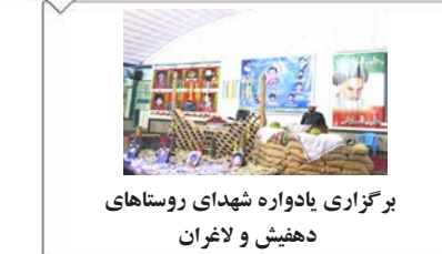
برگزاری یادواره شهدای روستاهای دهفیش و لاغران

روزنامه میلاد لارستان - سال بیست و هفتم - آذر ماه ۱۳۹۸ - ربيع الثانی ۱۴۴۱ - دسامبر ۲۰۱۹ - ۰۹/۱۱/۹۸ - شماره ۱۴۲۲ - صفحه تک شماره ۲۰۰۰ تومان