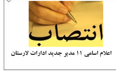
اعلام اسامی ۱۱ مدیر جدید ادارات لارستان

روزنامه میلاد لارستان - سال بیست و هفتم - آذر ماه ۱۳۹۸ - ربيع الثاني ۱۴۴۱ - دسامبر ۲۰۱۹ - ۹۸/۰۹/۲۵ - شماره ۱۴۲۸ - صفحه - تک شماره ۲۰۰۰ تومان