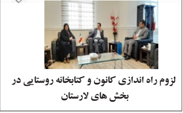
لزوم راه اندازی کانون و کتابخانه روستایی در بخش های لارستان