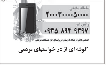
گوشه ای از درخواستهای مردمی