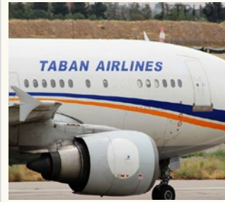
با آغاز فعالیت شرکت هواپیمایی تابان در فرودگاه لارستان، راه مسافری مردم منطقه لارستان و جنوب استان فارس به کشور عمان هموار خواهد شد.

به گزارش میلاد لارستان به نقل از روابط عمومی اداره کل فرودگاه بین المللی آیت الله آیت الهی لارستان، پرواز مسیری جدید مسقط - لار - مسقط با ۳۴ مسافر ورودی و ۷۴ مسافر خروجی از روز ۱۴ دیماه برقرار شد.