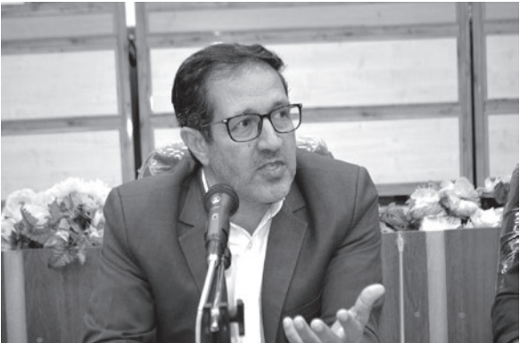
امثالهم می باشد، اینجا می‌توان پیشگیری کرد، اما اگر پیشگیری نکرديم و گسترش پیدا کرد کارمان سخت و تهدید جدی تر خواهد شد. فرماندار لارستان، ادامه داد: در حوالی همچون سیل و زلزله شهرستان های معینی وجود دارند که کمک می کنند اما در این موضوع هر شهرستانی درگیر مشکلات خود و اثرات روانی و واگیردار بودن آن ممکن است کمک های افراد به همدیگر را به حداقل برساند، بنابراین باید همه حساس باشیم و تک تک افراد متوجه خطر آفرینی موضوع باشند، تا انشاءالله پیشگیری و در صورت موارد محدود نیز مدیریت و کنترل شود.

فرماندار ویژه لارستان، جلیل حسینی در گفت و گو با خبرنگار ایرنا، اظهار داشت: در جهت پیشگیری و مقابله با ویروس کرونا تمامی مبادی ورودی و خروجی شهرستان لارستان با حضور عوامل بهداشت و درمان شهرستان و نمایندگان دیگر دستگاه‌های اجرایی عضو ستاد مدیریت بیماری کرونا کنترل می‌شود و افراد مشکوک قرنطینه خانگی یا در بیمارستان بستری می‌شوند. وی ادامه داد: ضد عفونی و گندزدایی شهر لار، مراکز بخش‌ها، هشت شهر و بخش قابل توجهی از روستاهای این شهرستان لارستان انجام شده است و هشدارهای لازم به مردم داده شده است. فرماندار ویژه شهرستان لارستان، گفت: تمامی مدارس، دانشگاه‌ها و مناطق گردشگری شهرستان لارستان به منظور پیشگیری و مقابله با ویروس کرونا تعطیل هستند و از پذیرش مسافر در این شهرستان معذور هستیم. حسینی، افزود: فعالیت اصناف و بازاریان شهرستان لارستان از جمله بازار قیصریه به حالت تعطیل یا نیمه تعطیل درآمده است. وی ادامه داد: با توجه به کمبود اقلام بهداشتی