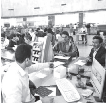
در جهت ریشه کن کردن این ویروس منجوس در شهرستان و منطقه فروگذار نمی‌کنند.