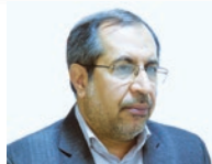
جعفر پور و مسیر پریچ و خم پنج ساله‌ای که در ایجاد دانشگاه فرهنگیان لارستان پیמוד