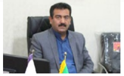
هدشار یگانه به مردم لارستان: توصیه ها را رعایت تکنید قوانین سخت گیرانه تر وضع می کنیم