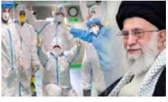
مدافعان سلامت، شهید خدمت» محسوب میشوند