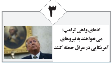
ادعای واهی ترامپ: می خواهند به نیروهای آمریکایی در عراق حمله کنند