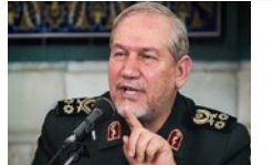
هدشار سرلشکر صغری به آمریکا درباره تحرکات مشکوک در عراق شکست بزرگی از مردم عراق میخورد