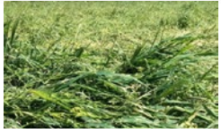
خسارت حدود ۲۴۲ هزار میلیون ریالی کشاورزی لارستان در بارندگی اخیر