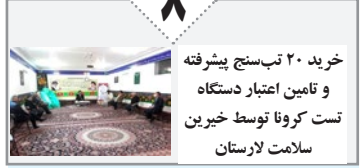
خرید ۲۰ تنبسخ بیشتره و تامین اعتبار دستگاه تست کرونا توسط خیرین سلامت لارستان