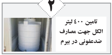
تامین ۴۰۰ لیتر الکل جهت مصارف ضد عفونی در بیم