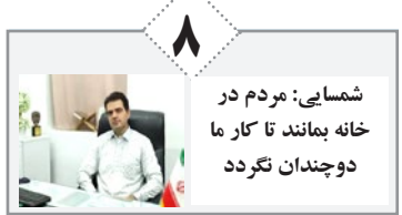
شمسین: مردم در خانه بمانند تا کار ما دوجندان نگرود