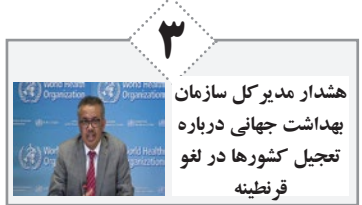
هدشار مدیرکل سازمان بهداشت جهانی درباره تمجیل کشورها در لغو قرنطینه