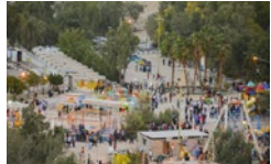
انسداد ورودی تمامی پارکها و بوستانهای شهر لار