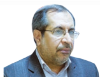
زویای پیدا و پنهان از ۸ سال نمایندگی مردم