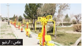
خطاب به شهرداری لار؛ پارک سلامت نیاز به توسعه دارد

روزنامه میلاد لارستان - سال بیست و هشتم - خرداد ماه ۱۳۹۹ - شوال ۱۴۴۱ - مه ۲۰۲۰ - ۹۹/۰۳/۱۷ - شماره ۱۵۰۴ - صفحه تک شماره ۲۰۰۰ تومان