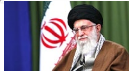
بازخوانی توصیه‌های کلیدی رهبر انقلاب به نمایندگان مجلس