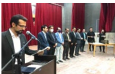
تجلیل از برگزیدگان دوسابقه مجازی «معرفی کتاب» و «خوانندگی و تکنوازی»