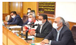
تشکیل جلسه فوری شورای هماهنگی ستاد مدیریت بحران شهرستان لارستان