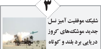
شلیک موفقیت آمیز نسل جدید موشک‌های کروز دریایی برد بلند و کوتاه