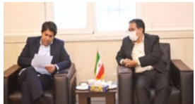
دیدار رئیس سازمان صنعت معدن و تجارت استان فارس با معاون استاندار و فرماندار ویژه لارستان