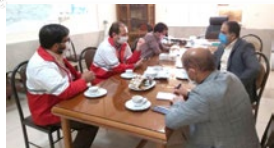
«خانه هلال» در بیرم راه اندازی می‌شود