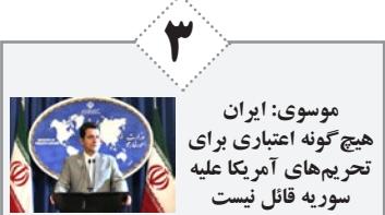
موسوی: ایران هیچ گونه اعتباری برای تحریم‌های آمریکا علیه سوریه قائل نیست