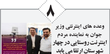
وعده های اینترنتی وزیر جوان به نماینده مردم اینترنت روستایی در چهار شهرستان ارتقا می یابد