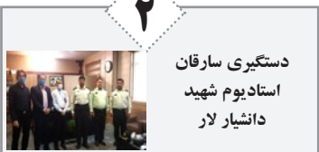
دستگیری سارقان استاد یوم شهید دانشیار لار