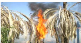
۲۰هکتار از مزارع بلغان طعمه حریق شد