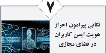
تکاتی پیرامون احراز هویت ایمن کاربران در فضای مجازی