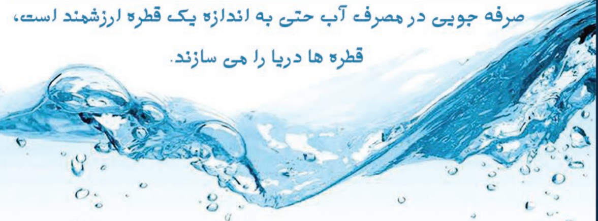
صرفه جویی در مصرف آب حتی به اندازه یک قطره ارزشمند است، قطره‌ها دریا را می‌سازند.

از آب حفاظت کنید، چون زندگی ما به آن وابسته است. هیچگاه به دلیل اینکه فرد دیگری مسئول پرداخت آب بهاست، آب را هدر ندهید. از شهروندان تقاضا می‌شود تا ضمن رعایت دستورالعمل‌های بهداشت فردی تا حد امکان از مصارف غیر ضروری مانند شست‌وشوی فرش، پتو، درها و پنجره‌ها فعلاً خودداری کنند تا برای مصارف ضروری دچار کمبود آب نشویم و این مقطع حساس را بدون کم‌آبی و قطع آب سپری کنیم. اگر برای شستن دست‌ها ۲۰ ثانیه زمان نیاز باشد و در طول این مدت زمان تماماً شیر آب باز باشد پیش از ۶ لیتر آب هدر می‌رود از این رو افراد برای شستن دست‌ها مسائل مربوط به رعایت مصرف آب را مد نظر داشته باشند.