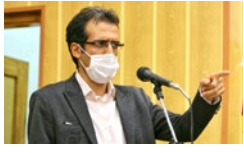
باید به موضوع قدرتمندتر شدن و افزایش رسانه‌های رسمی و مجوزدار اهتمام داشت

روزنامه میلاد لارستان - سال بیست و هشتم - چهارشنبه ۲۲/۰۵/۹۹ - بیست و دوم ذی‌الحجه ۱۴۴۱ - ۱۲ آگوست ۲۰۲۰ - شماره ۱۵۴۱ - ۸ صفحه - تک شماره ۲۰۰۰ تومان