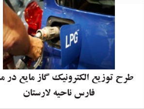
طرح توزیع الکترونیک گاز مایع در منطقه فارس ناحیه لارستان