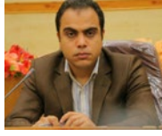
افتتاح بزرگترین مرکز رشد خیرساز کشور در لارستان، گام بزرگ ۹۹ سال