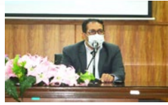
درخواست فرماندار لارستان برای ساماندهی فعالیت رسانه ای در لارستان