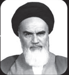
امام خمینی (ره):

این‌هایی که تزریق می‌کنند به شما «ملت گریه»، «ملت گریه»، این‌ها خیانت می‌کنند، بزرگ‌هایشان و ارباب‌هایشان از این گریه‌ها می‌ترسند.