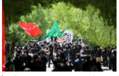
تجلی شور و شعور حسینی در روزهای کرونایی