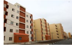
پروژه ۸۸ واحدی مسکن، در شهرک اندیشه لار احداث می شود