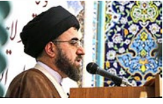
«صنایع مادر» در لارستان ایجاد شود/ مسوولان نباید با جملات انشایی با مردم صحبت کنند