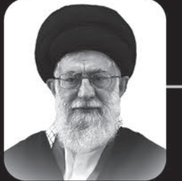
مقام معظم رهبری:

پروردگارا! تو را به حسین و زینب علیهما السلام قسم می‌دهیم که ما را جزو دوستان و یاران و دنباله‌روان آنان قرار بده. پروردگارا! حیات و زندگی ما را زندگی حسینی و مرگ ما را مرگ حسینی قرار بده.