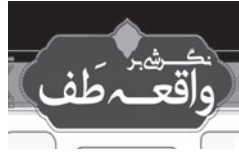
تکرشی بر واقعه طف